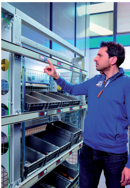
Kurze Laufwege und direkte Bestätigung von Picks gegenüber der Entnahme.