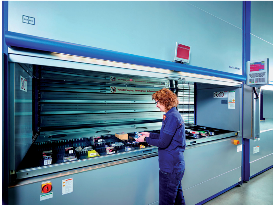
Ergonomische und sichere Entnahme beim automatischen Vorpositionieren durch vorgelagerten Lichtschrankenvorhang.

Über der vorgesehenen Kommissionierbox leuchtet eine Diode in der Liftfarbe des benötigten Artikels. Der Mitarbeiter weiß nun sofort, aus welchem Lift er die Ware entnehmen muss. Im Entnahmebereich wird durch das System Pick-o-Light-Vario von Hänel der benötigte Artikel verwechslungsfrei per Lichtmarkierung angezeigt. Die zu entnehmende Stückzahl wird direkt an der Steuerung eingblendet. Die erforderlichen Artikel